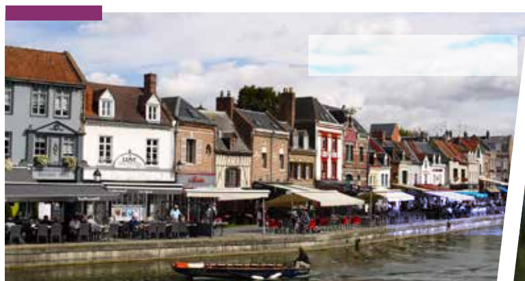
^ Quartier Saint-Leu

Enfin, la ville s'est dotée d'un réseau de transport en commun performant et met également l'accent sur les déplacements verts en offrant plus de 200 km de voies cyclables.