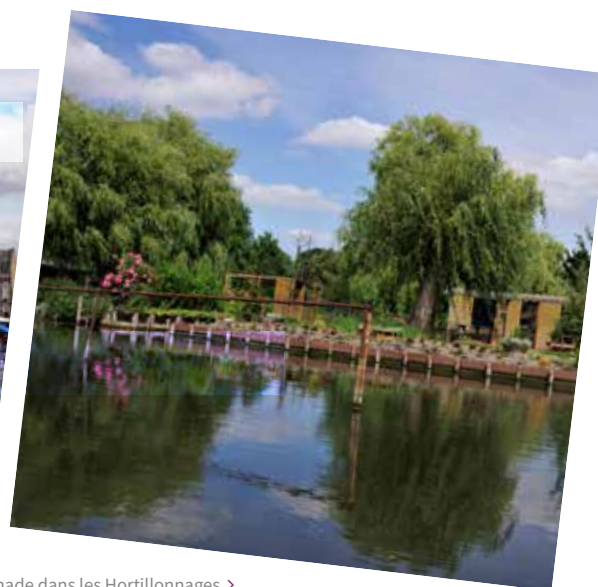
Promenade dans les Hortillonnages >